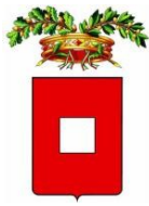
Provincia di Piacenza