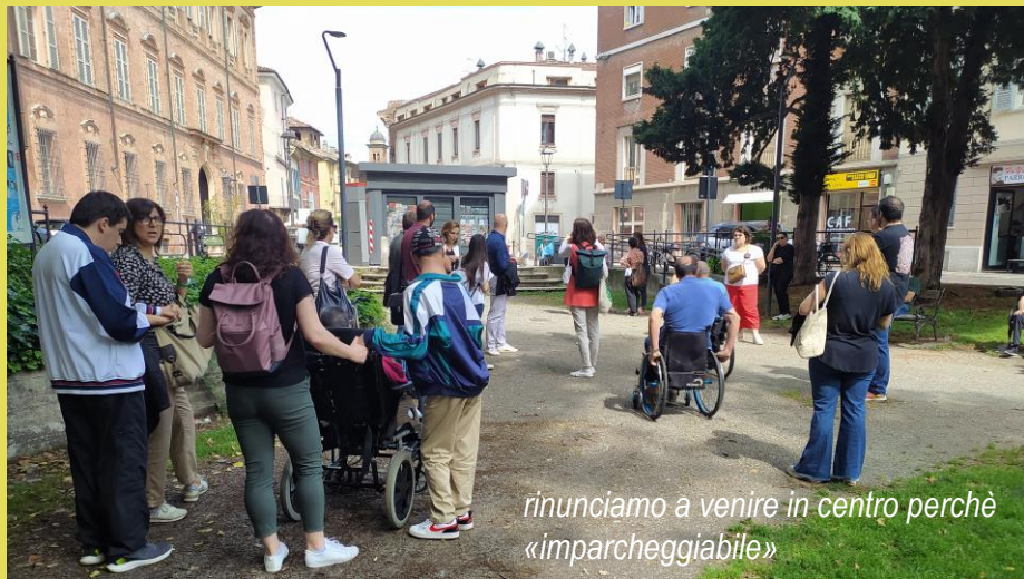
rinunciamo a venire in centro perché «imparceggiabile»