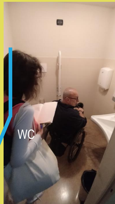
auspicabile un maniglione a L su parete laterale al WC anche ad uso delle persone anziane

esempio d'uso dei simboli della CAA Comunicazione Aumentativa Alternativa ma su porta ad anta... quando rimane aperta, i simboli si leggono solo in uscita