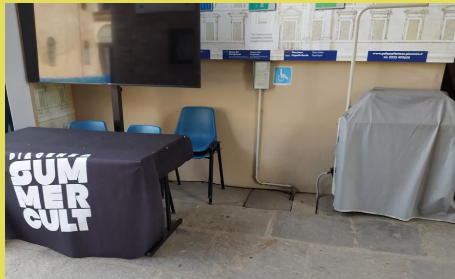
ore 13.21 😊 gli addetti della cassa hanno provveduto a spostare il tavolo