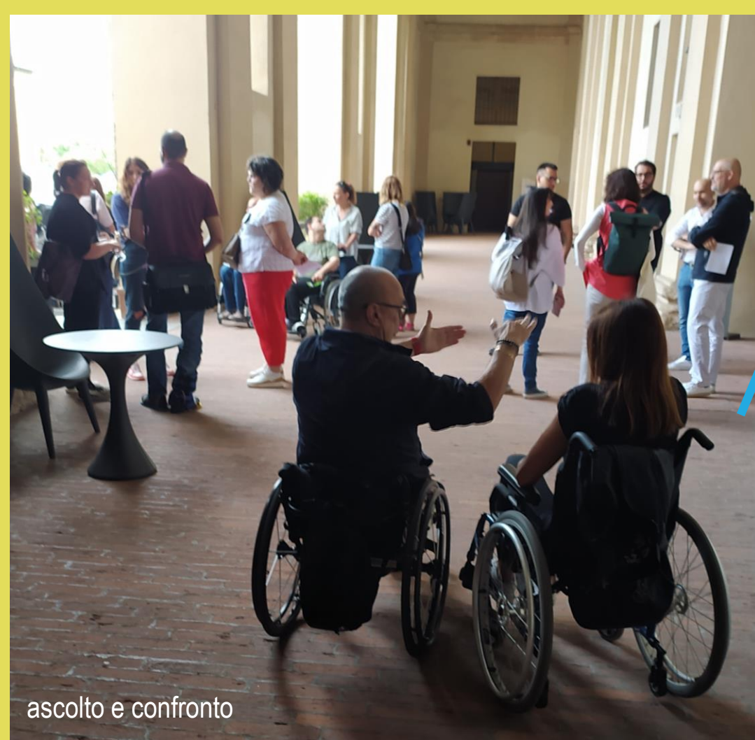
ascolto e confronto