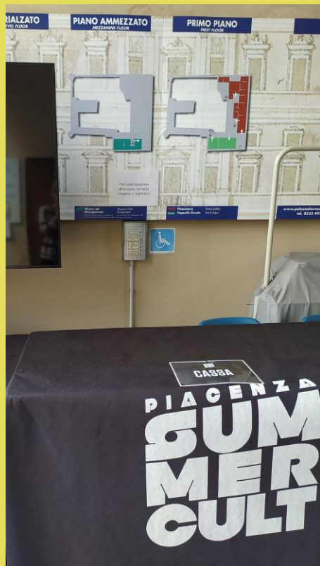
ore 9.20 ingombro temporaneo davanti al pulsante di chiamata