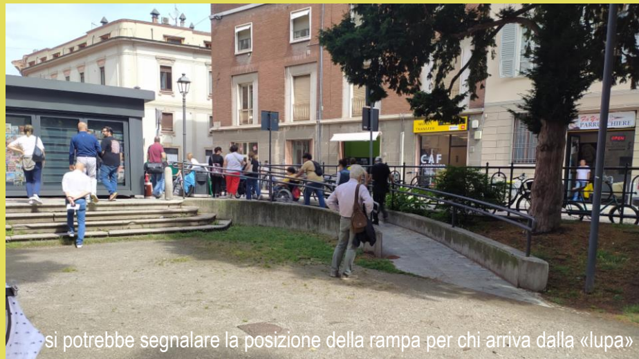
si potrebbe segnalare la posizione della rampa per chi arriva dalla «lupa»