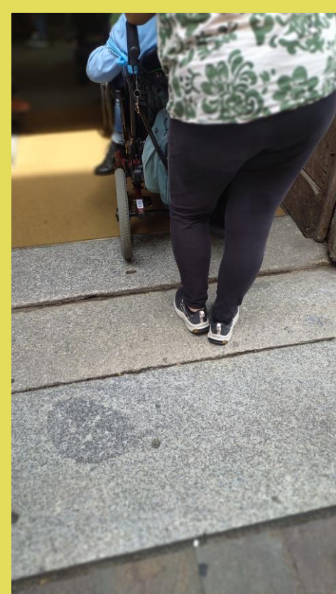
sequenza di piccoli dislivelli