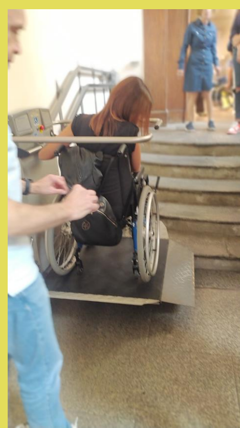
sperimentare per capire