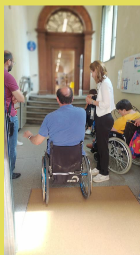
aspettando gli operatori (che sono stati molto gentili)