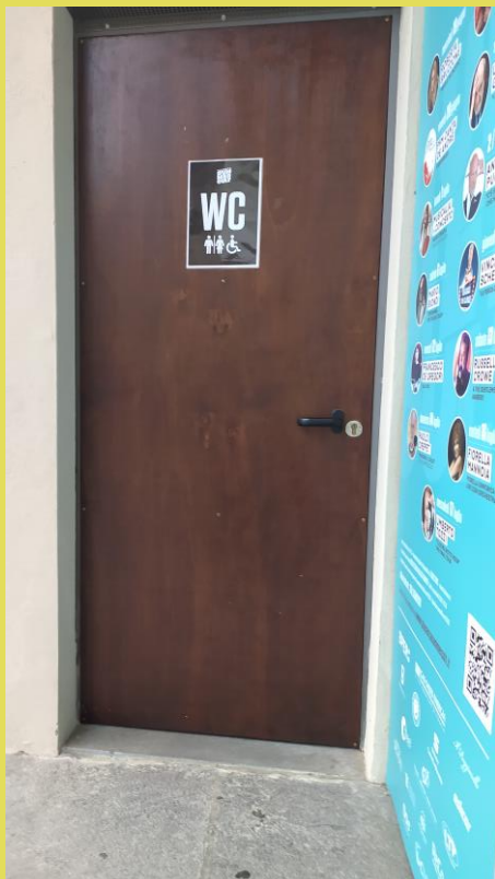
WC con porta al piano in androne di ingresso! ma al momento chiusa